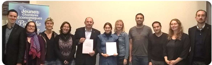
Les présidents et membres des bureaux fédéraux de la JCE NPDCP à Albert (80) le 07/11/15.